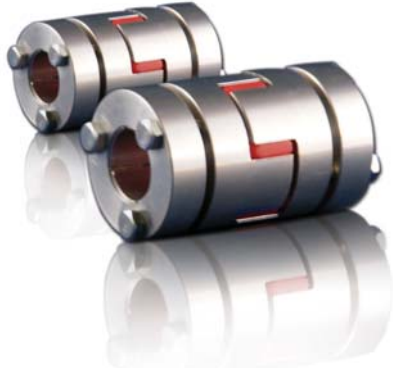
CM-J-TB 外六尺寸表 / Dimension